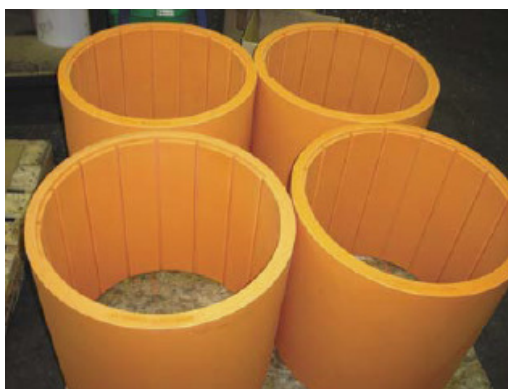
Лагери за валолинията от Thordon COMPAC смазвани с морска вода

При новостроящите се кораби, лагерните системи на Thordon COMPAC за валолинията са с гарантирана пред регистровите организации 15 годишна износоустойчивост, или в противен случай Thordon Bearings Inc. ще достави нови лагери без заплащане от корабособствениците. Тази гаранция за лагерните системи на компанията са насочени основно към новостроящите се търговски съдове с диаметър на гребния вал 300 mm (12") и повече с валолиния оборудвана с лагери COMPAC.